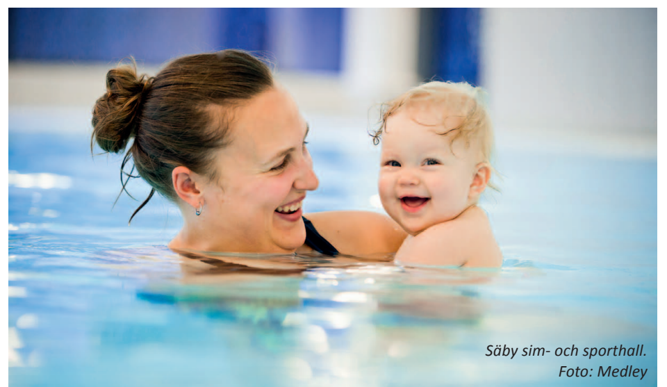
Säby sim- och sporthall.