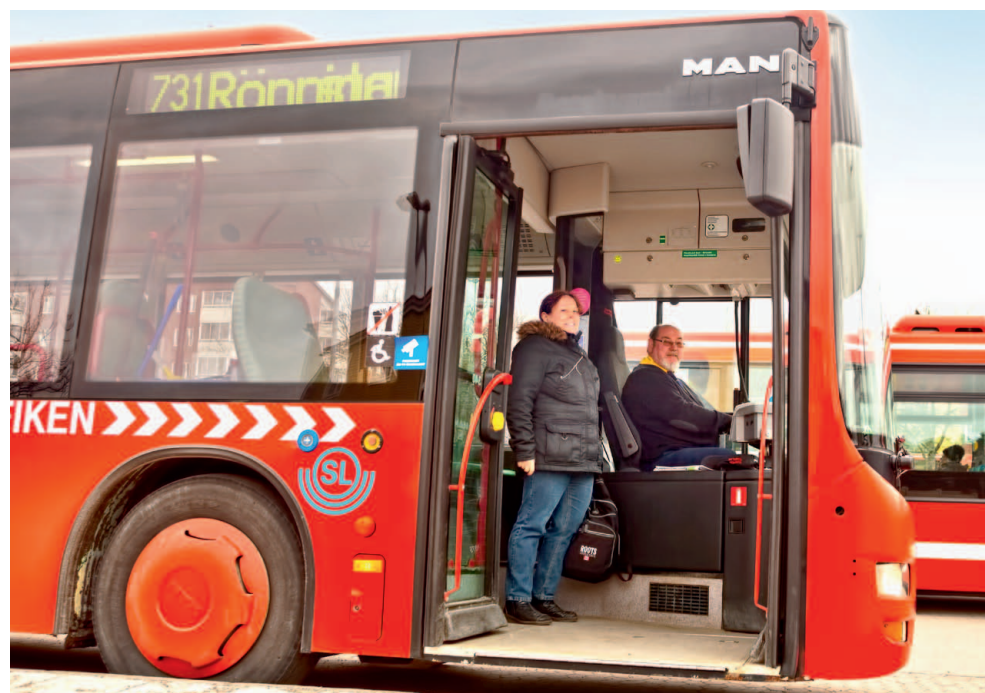
Ny busslinje i Rönninge.