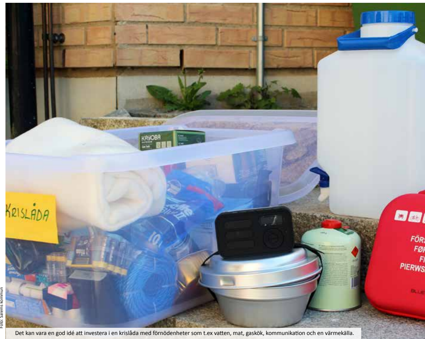
Det kan vara en god idé att investera i en krislåda med förnödenheter som t.ex vatten, mat, gaskök, kommunikation och en värmekälla.

Den svenska krisberedskapen bygger på att alla tar ett gemensamt ansvar för samhällets och vår egen säkerhet. Det egna ansvaret innebär att du ska vara förberedd på att kunna hantera en svår situation och klara de omedelbara behov som kan uppstå. För att klara att ta hand om sig själv och sina närmaste, åtminstone i det inledande skedet av en kris, är det bra att förbereda sig. God krisberedskap är otroligt viktigt! Det kan innebära att se till att ha ett förråd av sådant som du själv behöver, till exempel mat, mediciner, batterier och stearinljus. Tänk igenom vad du behöver ha hemma,