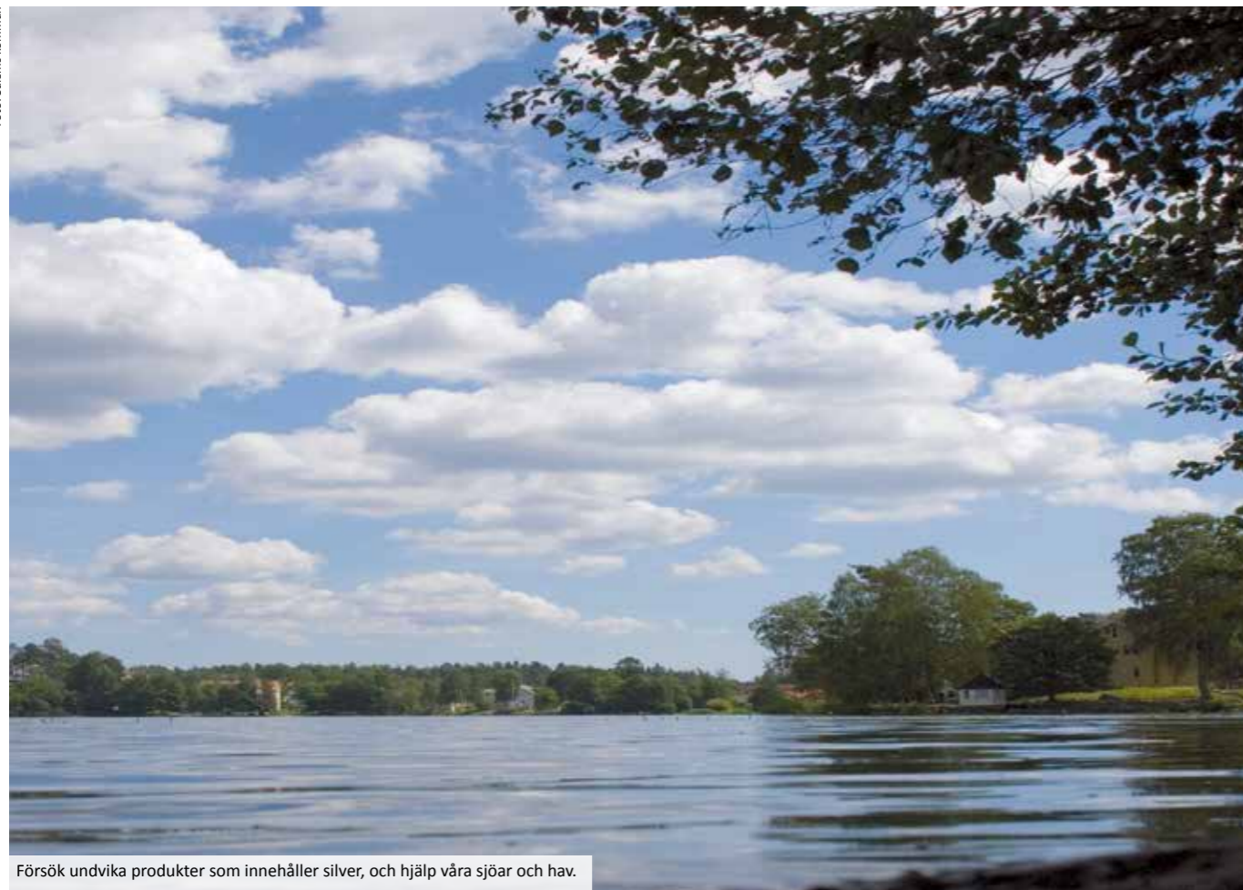
Försök undvika produkter som innehåller silver, och hjälp våra sjöar och hav.