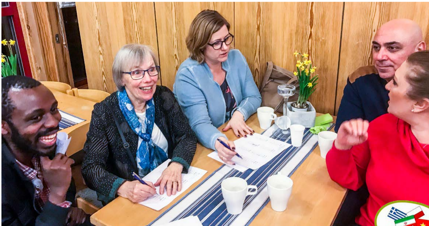
Mycket prat och skratt blev det bland de över 80 personer som deltog i Mat & Prata den 23 mars.