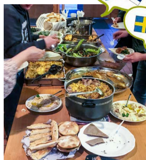
Denna gång dukades en buffé med arabisk kycklingryta, hummus, kebeh, taboule, vinblads- dolmar, kryddat ris, fatoosh, aubergineröra med mera. Nästa gång blir det svenska smaker.

– Så himla kul och givande! Fantastisk arabisk mat och massor av prat. Infödda svenskar och Salemsbor - anmäl er som språkvän nu. Ni behövs och är efterlängtda!