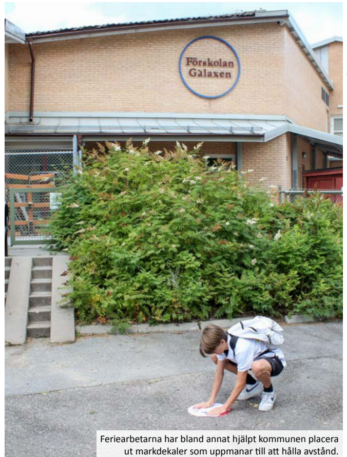
Feriearbetarna har bland annat hjälpt kommunen placera ut markdekalor som uppmanar till att hålla avstånd.