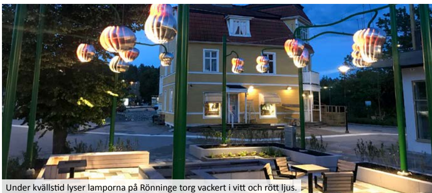
Under kvällstid lyser lamporna på Rönninge torg vackert i vitt och rött ljus.