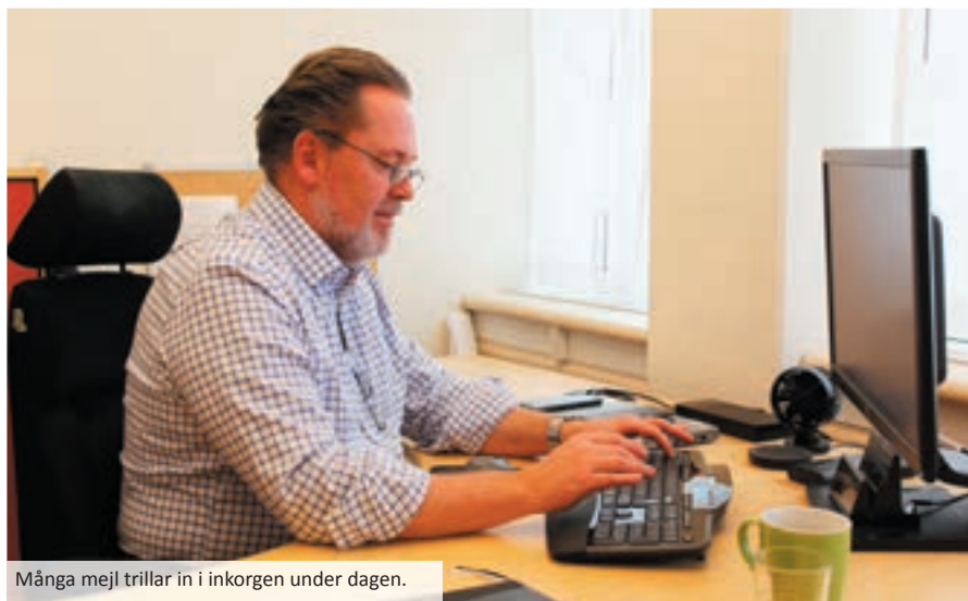
Många mejl trillar in i inkorgen under dagen.

12.00: Gemensam lunch med KLG. Efter kommunledningens sammanträde går de ut för en gemensam lunch på den lokala restaurangen i Salems centrum, Terassen. – Det blir tyvärr inte många matlådor hem-