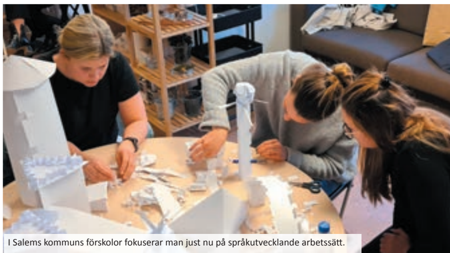
I Salems kommuns förskolor fokuserar man just nu på språkutvecklande arbetssätt.

Utvecklingspedagogerna fick sedan uppdraget att skapa med papper utifrån temat "Staden". Inget lim eller tejp fick användas,