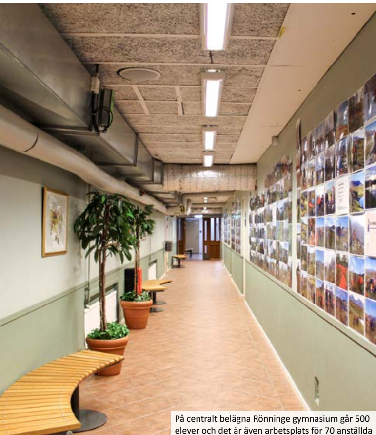
På centralt belägna Rönninge gymnasium går 500 elever och det är även arbetsplats för 70 anställda