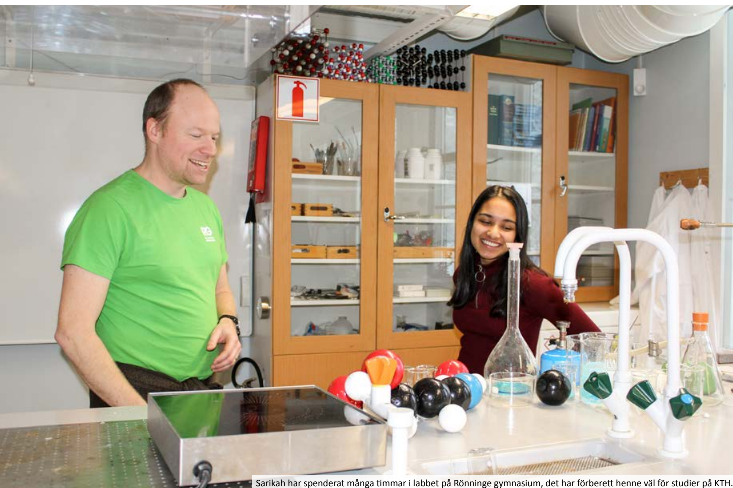
Sarikah har spenderat många timmar i labbet på Rönninge gymnasium, det har förberett henne väl för studier på KTH.