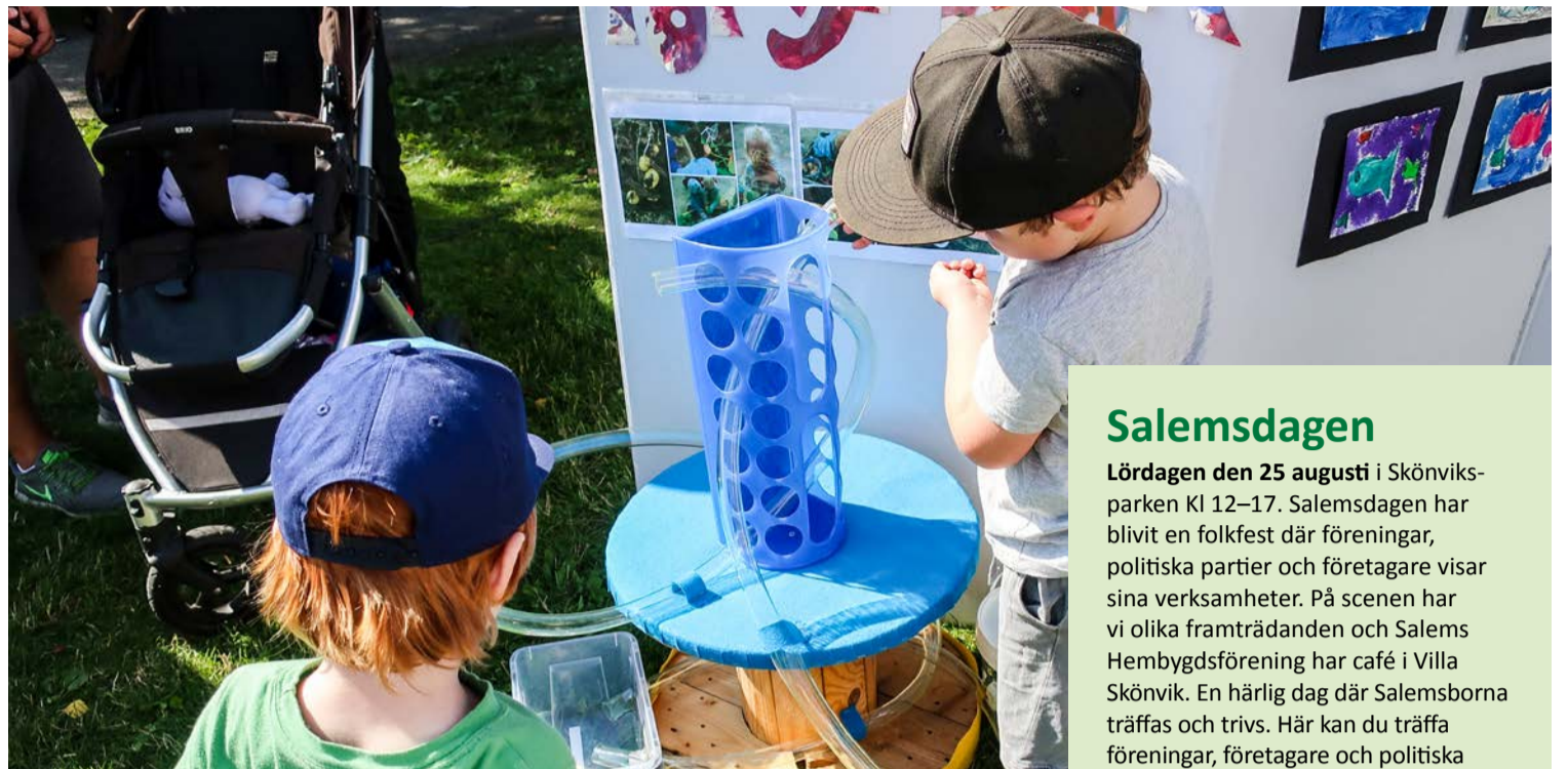
Bild från Salemsdagen 2017