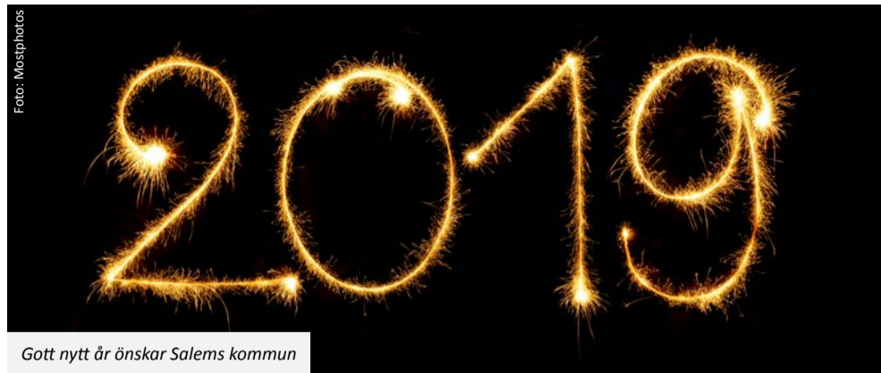
Gott nytt år önskar Salems kommun