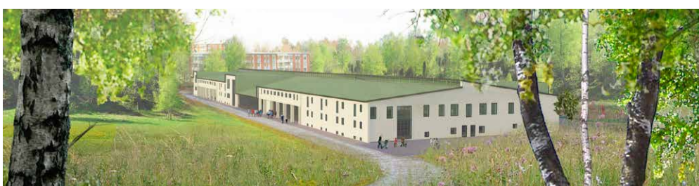
Exempelskiss på hur en skola av denna storlek kan se ut.