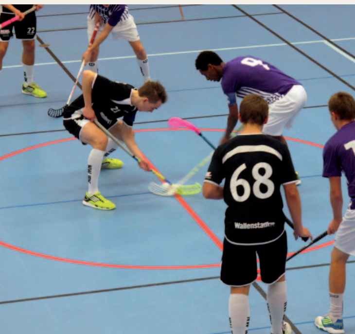
Juniorallsvenskans gruppspel. Salems IF spelar mot Nacka.