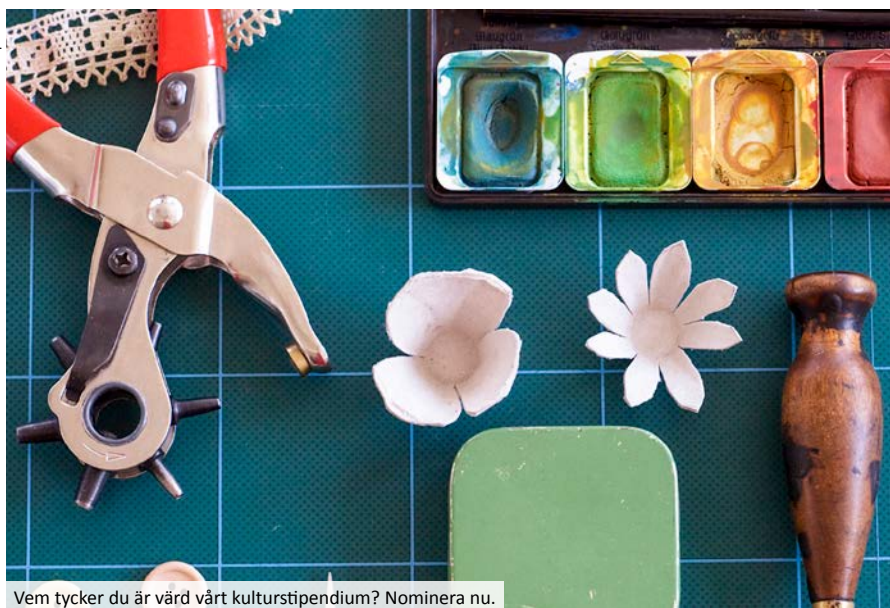
Vem tycker du är värd vårt kulturstipendium? Nominera nu.