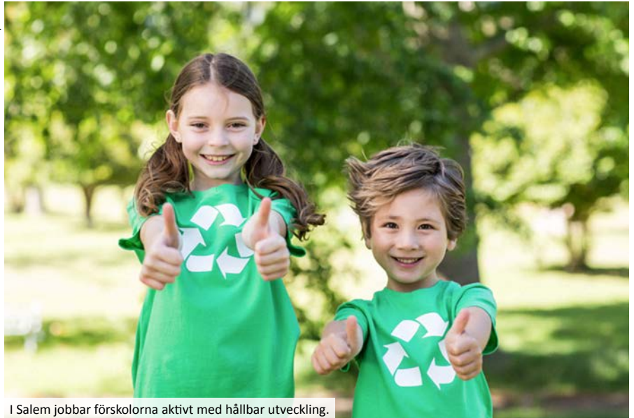
I Salem jobbar förskolorna aktivt med hållbar utveckling.

av vad man har gjort och skickar den till Håll Sverige Rent för granskning. Kommer Håll Sverige Rent fram till att arbetet med miljö- och hållbarhetsfrågor når upp till ett antal krav som ställs får förskolan eller skolan Grön Flagg-certifiering.