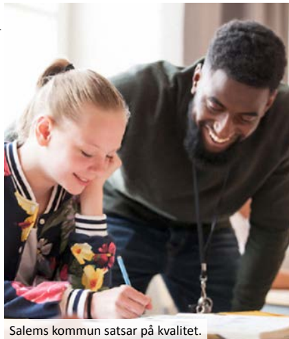
Salems kommun satsar på kvalitet.

att utveckla och förbättra kvaliteten i Salems förskolor och skolor. Vi hoppas därför på en hög svarsfrekvens. Tack för din hjälp för att göra Salems förskolor och skolor ännu bättre!