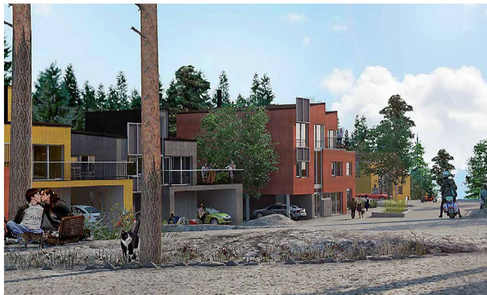
Illustration från idéförslaget.

I idéförslaget från fastighetsbolaget finns sju olika hustyper redovisade. Storleken på husen varierar mellan 100 och 187 kvadratmeter. Tanken är att bebyggelsen ska utformas så att den smälter in i naturen. Bolaget vill även bygga 54 småhus söder om Högantorpsvägen, på mark som ligger i Södertälje kommun. Därför beslutade kommunstyrelsen att kontakter ska tas med Södertälje kommun för att diskutera ett eventuellt samarbetsavtal.